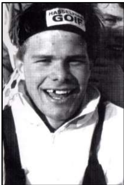
Nybliven segrare i junior SM 1991

Totalt 39 guldmedaljer i samtliga klasser, ett strålande resultat som vi alla kan glädjas åt.