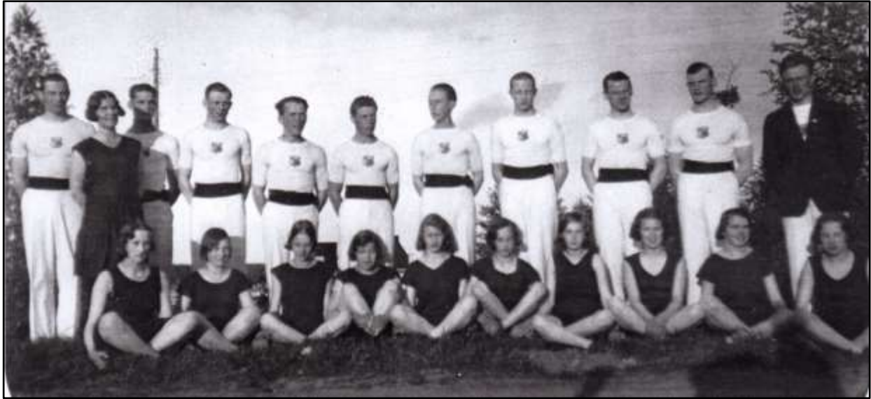
Elitgymnastgruppen vid gymnastikens dag i Hasselfors den 5 juni 1932.