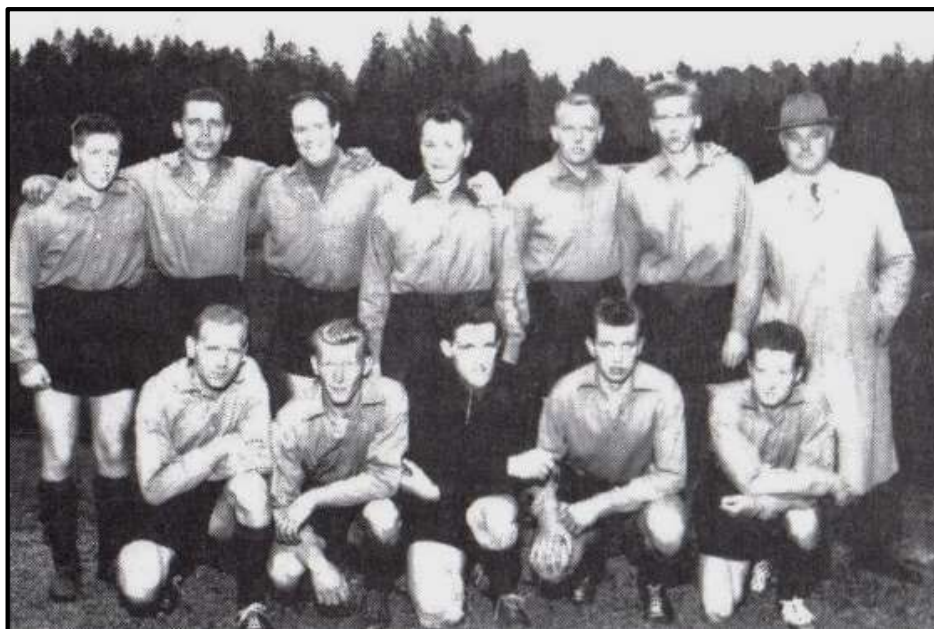
HGoIF-laget som 1959 vann div 6.