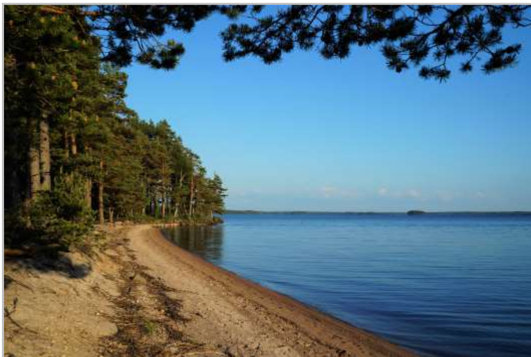
”Straffängsand” vid Toften