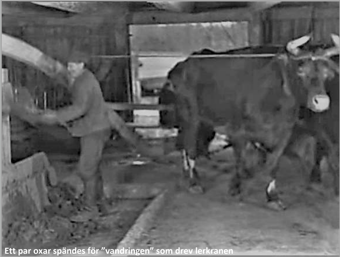
Ett par oxar spändes för "vandringen" som drev lerkranen