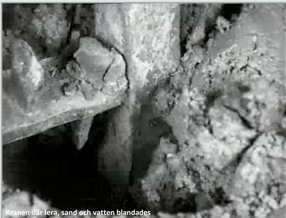
Kranen där lera, sand och vatten blandades