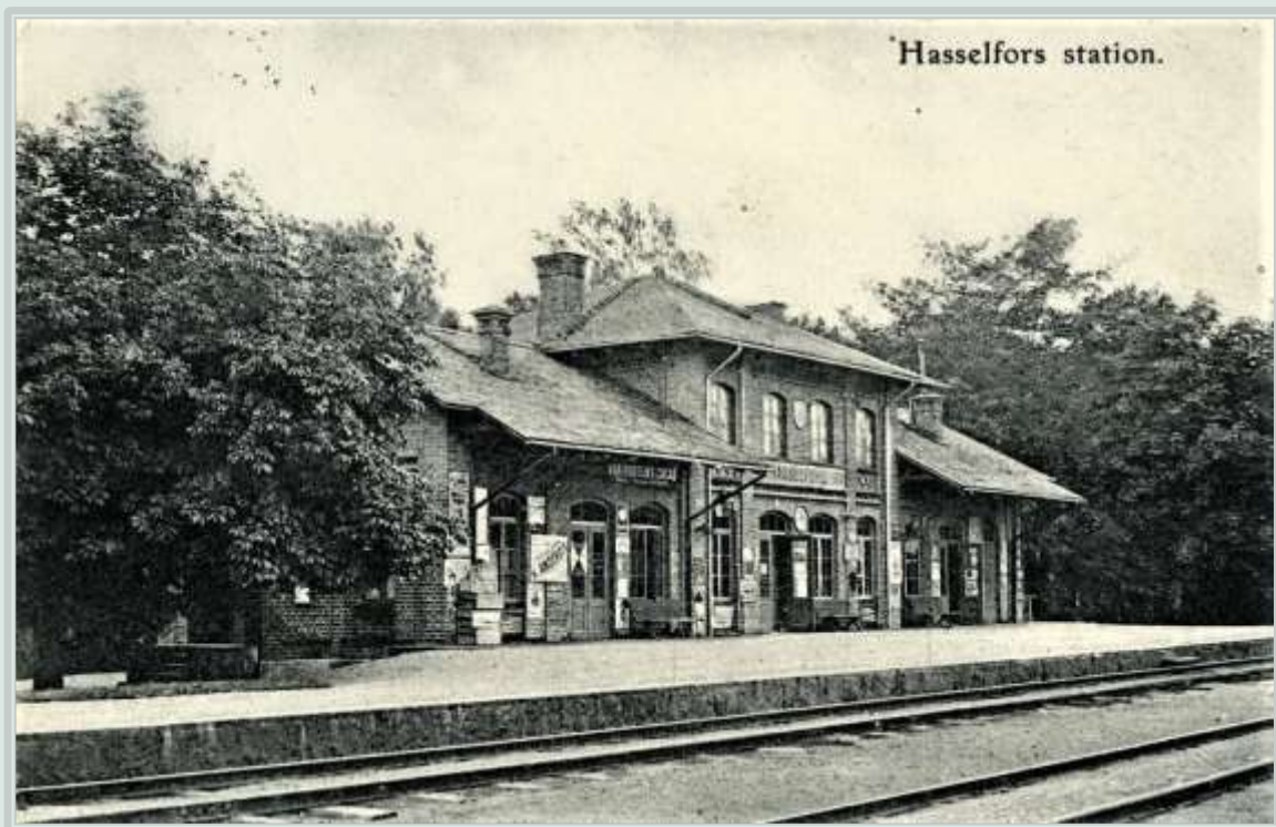
Hasselfors station med tegel från Fagersands tegelbruk invigdes år 1866, foto 1910.