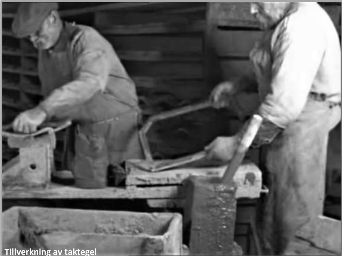
Tillverkning av taktegel