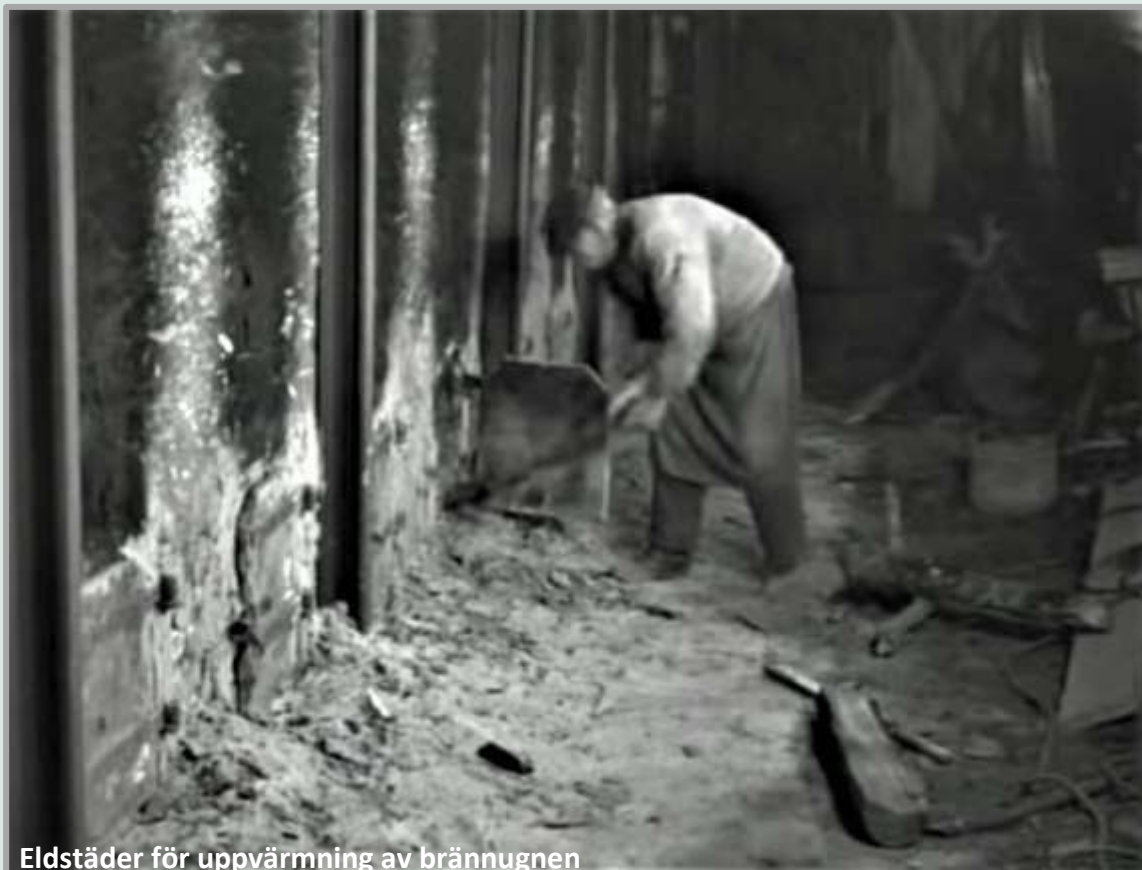
Eldstäder för uppvärmning av brännugnen