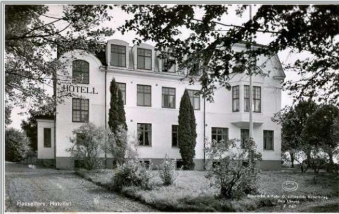
Hasselfors hotell är uppfört med tegel från Fagersands tegelbruk.