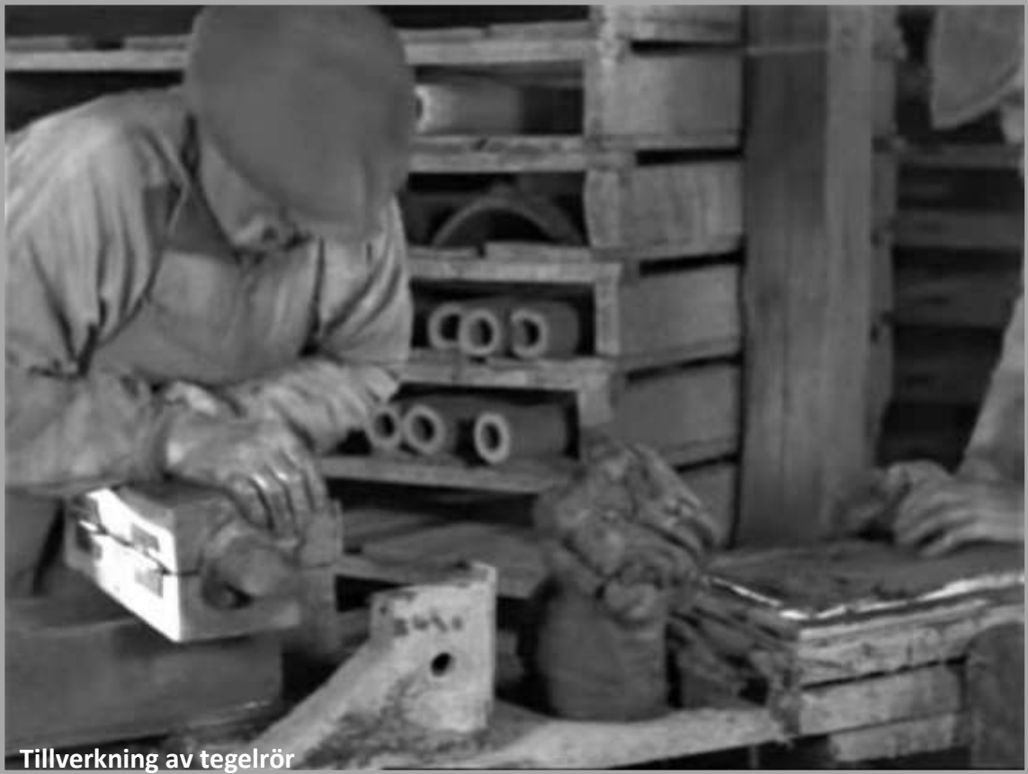
Tillverkning av tegelrör