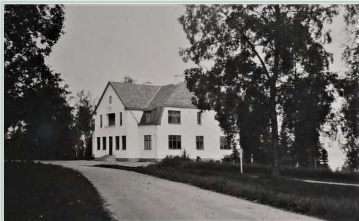
Hasselfors Bruks huvudkontor, med tegel från Fagersands tegelbruk.