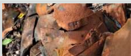
Taktegel som tillverkades vid Fagersands tegelbruk märktes med ett H på klacken.

Tegelhuset i Fagersand låg utmed sjöstranden och för att förhindra att huset riskerade att rasa ned i sjön Toften byggdes en stenmur mot vattnet. Rester av muren finns kvar än idag. Brännugnen var placerad ett stycke nordöst om tegelhuset.”