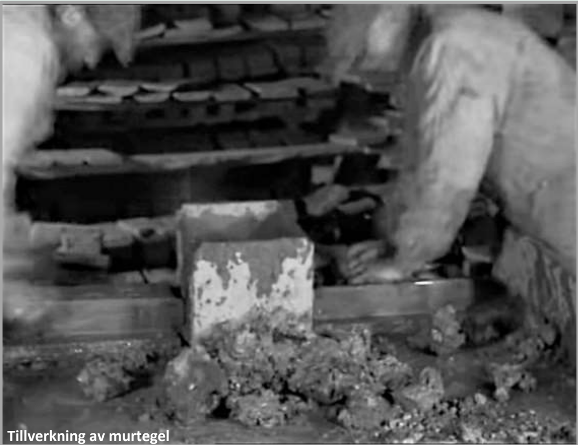
Tillverkning av murtegel