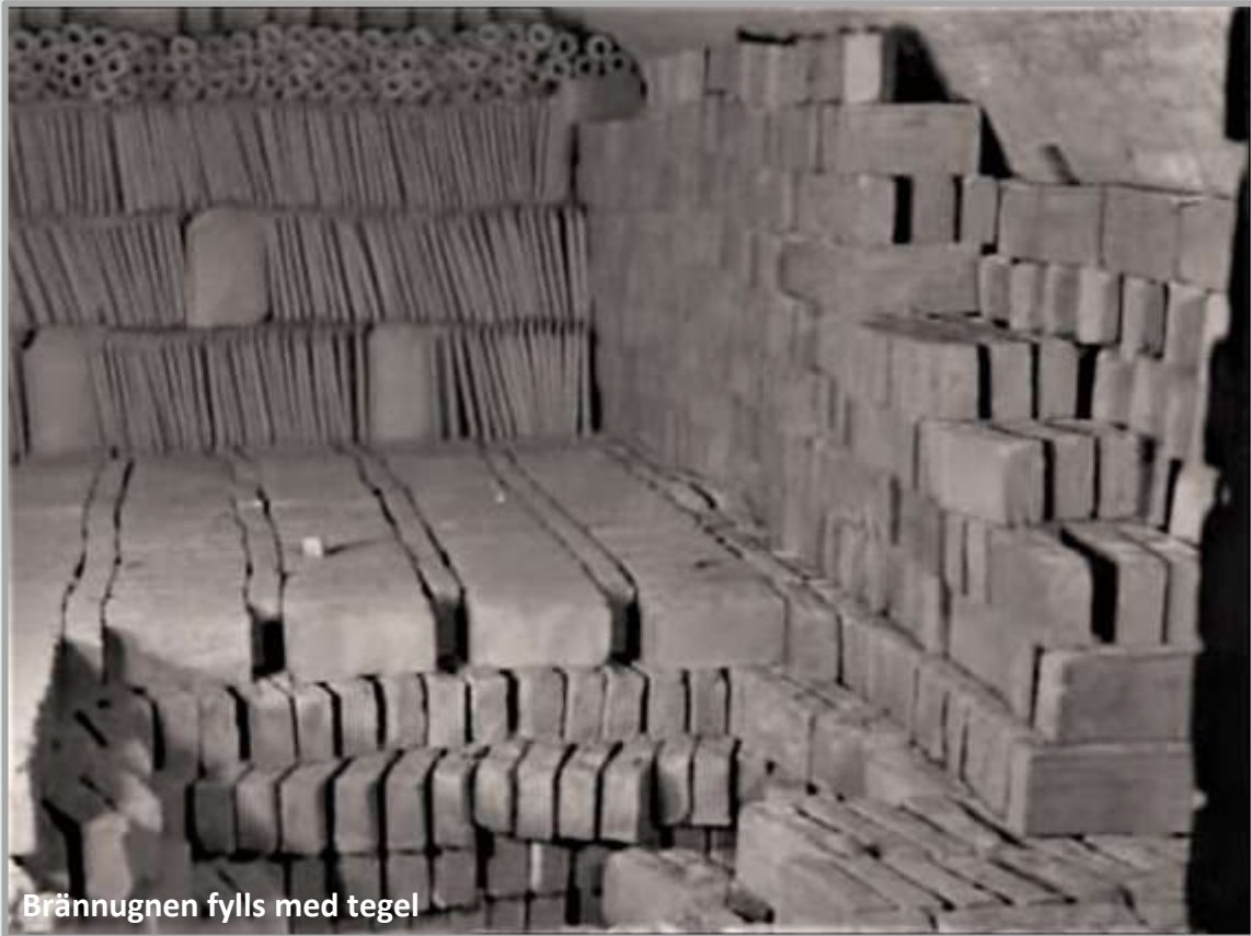
Brännugnen fylls med tegel