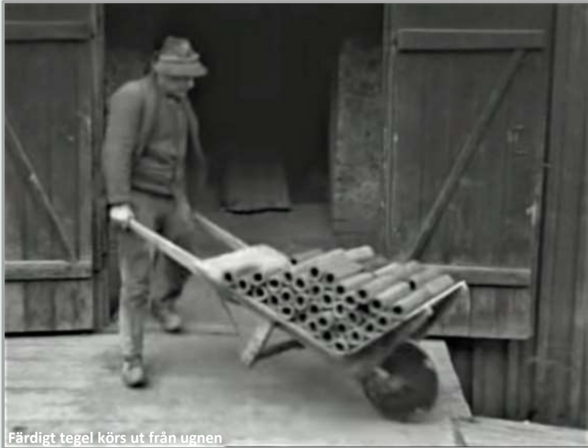
Färdigt tegel körs ut från ugnen