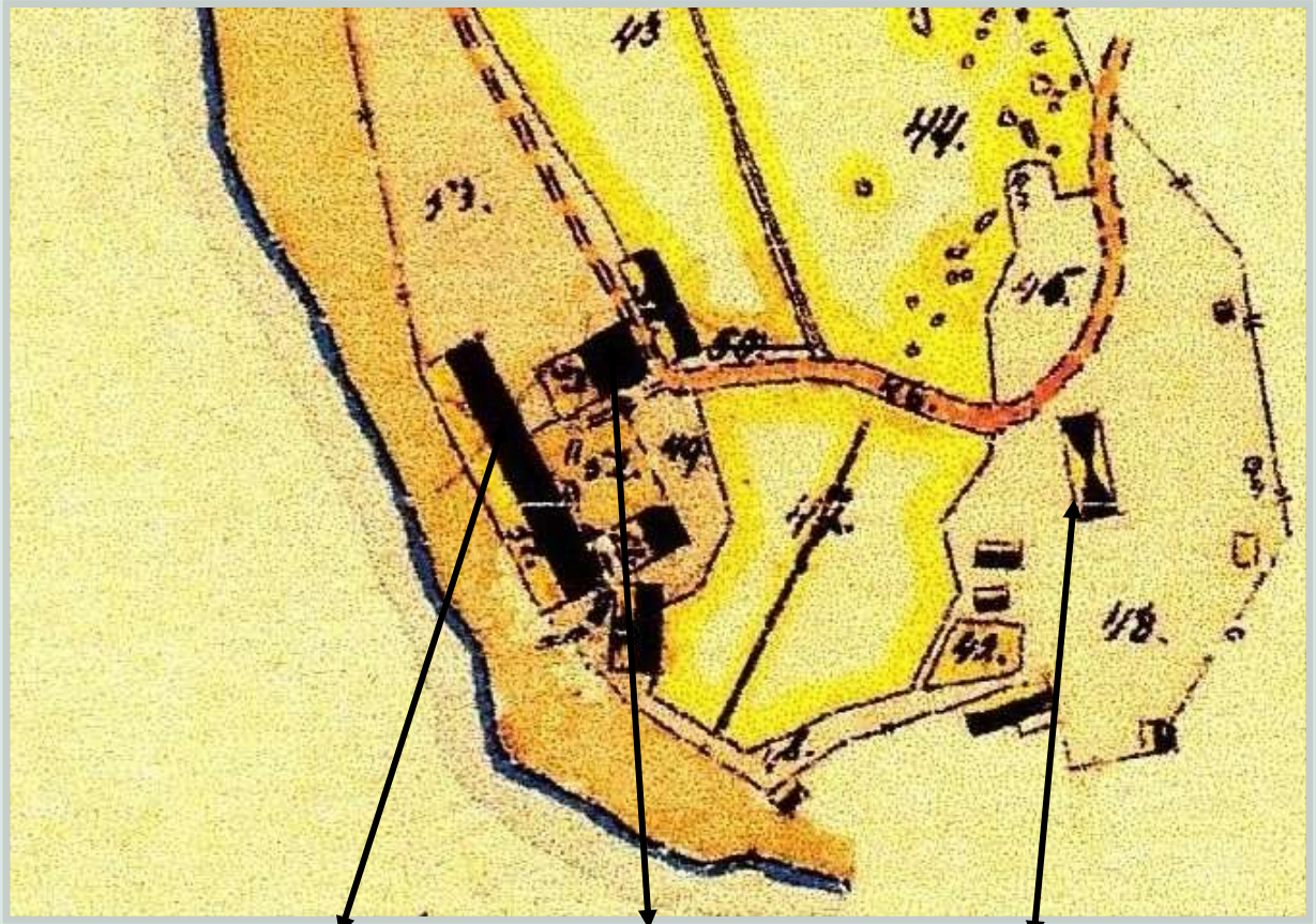
Tegelhuset, tillverkning och lager Brännugn Torpstället Tegelbruket