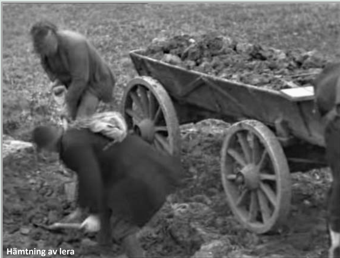
Hämtning av lera

På samma sätt tillverkades tegel vid Fagersands Tegelbruk vid Toften, väster om bruksorten Hasselfors i Skagershults socken i Närke.