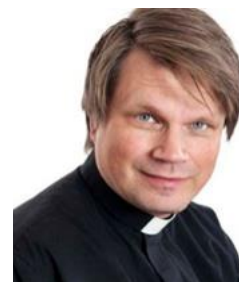
Församlingspräst Skagershults församling Kyrkoherde för Bodarne pastorat