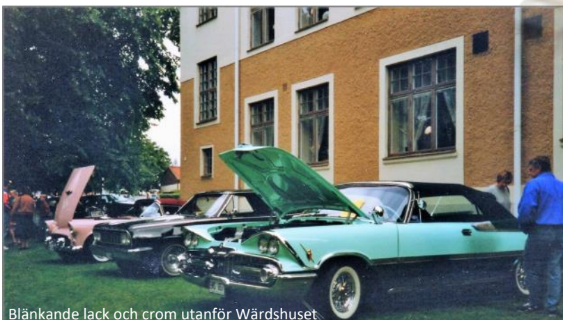
Blänkande lack och crom utanför Wårdshuset.