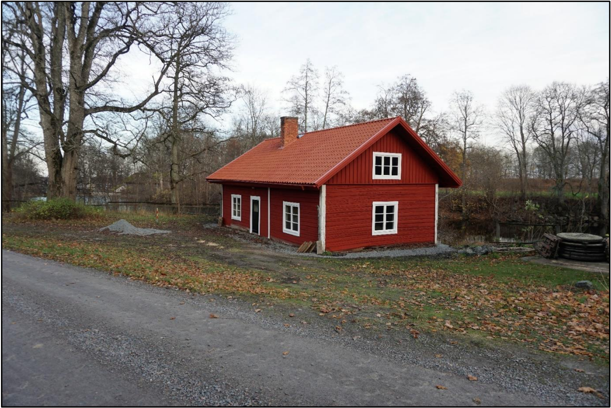
Brygghuset, 5 november 2020