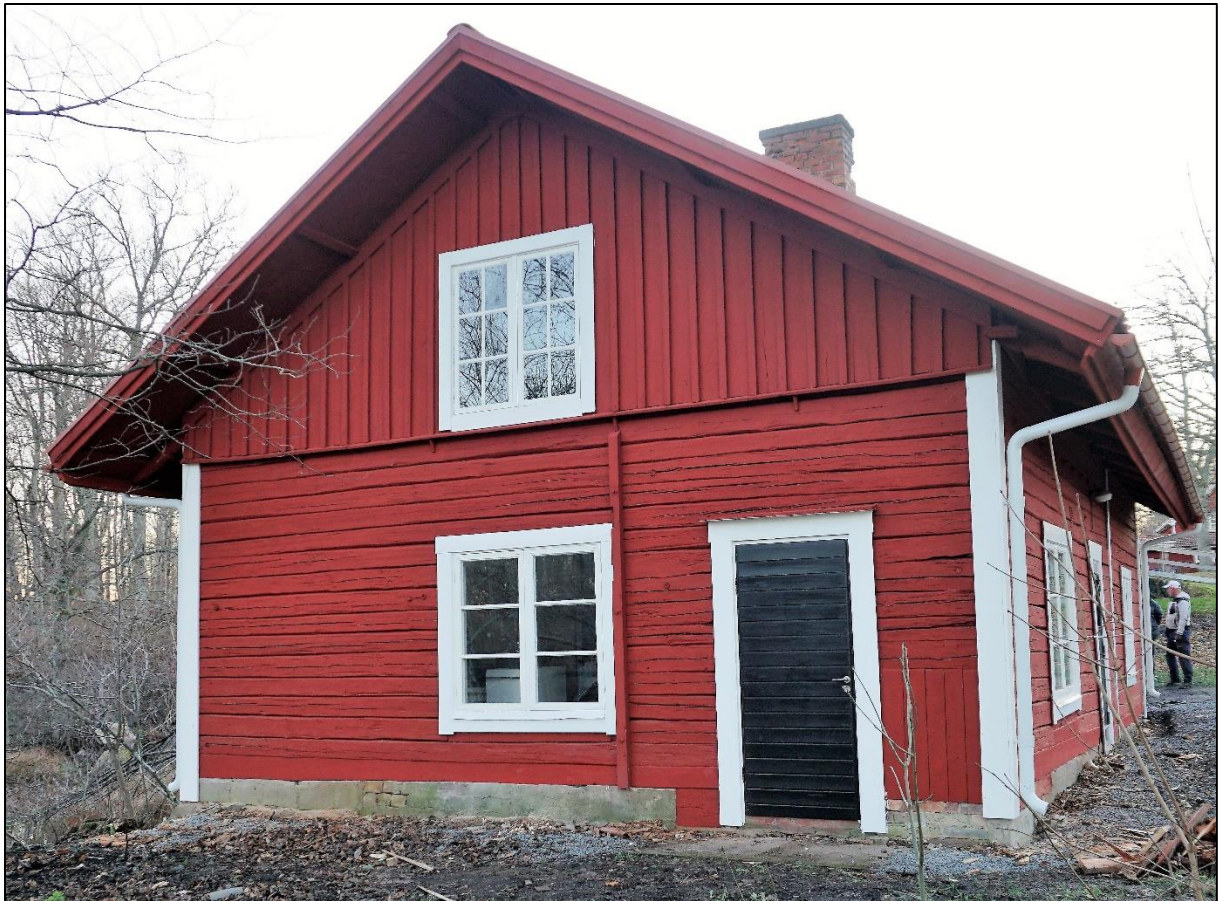
Norra gaveln, 23 november 2020