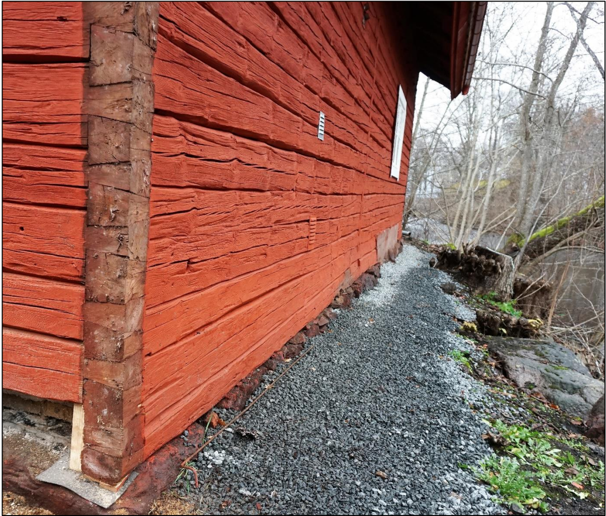
Östra långsidan, 18 november 2020.