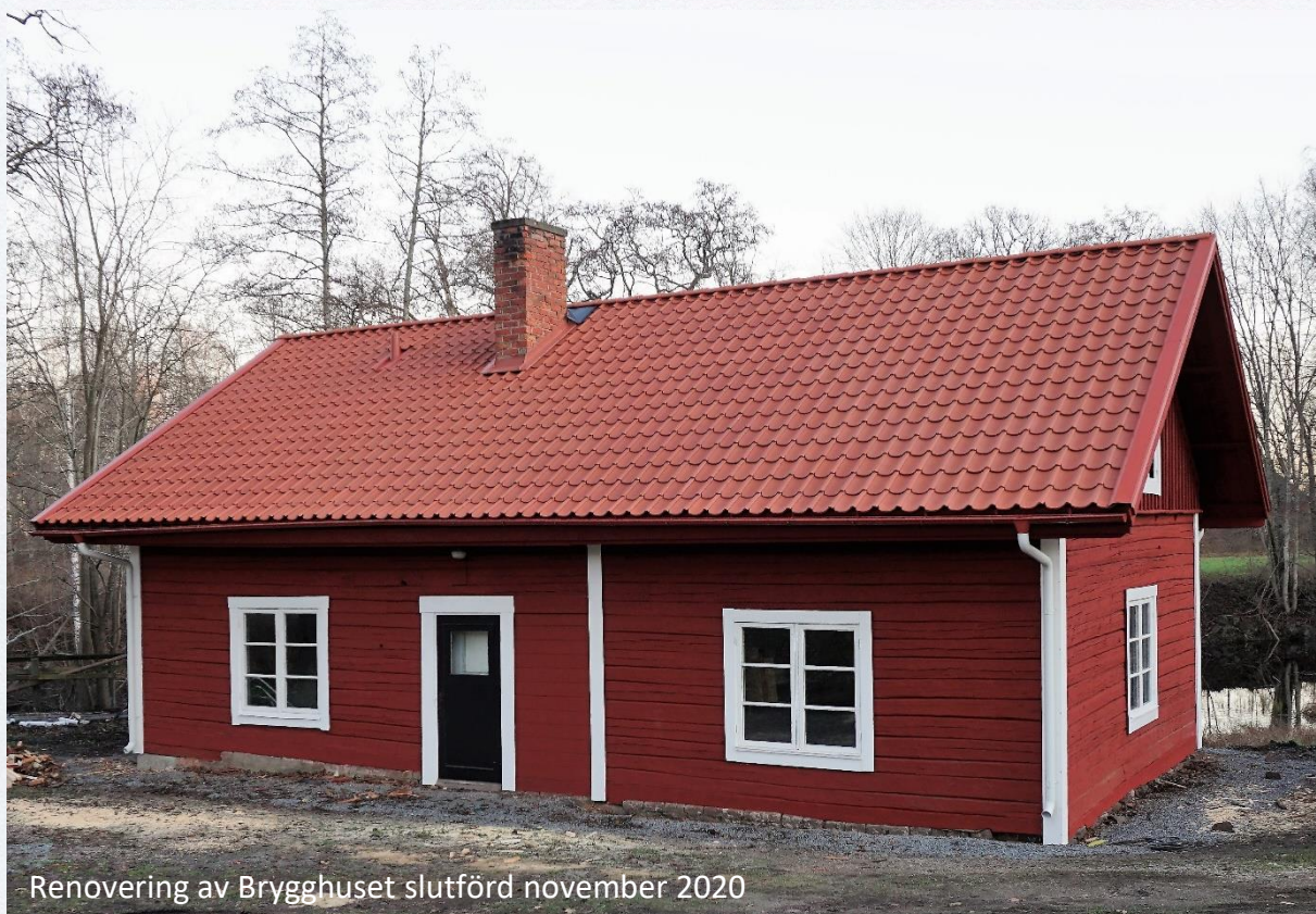
Renovering av Brygghuset slutförd november 2020