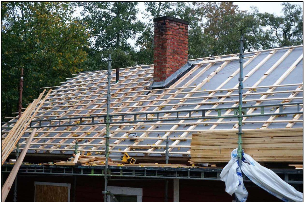
Uppriktning och läktning av taket, september 2020