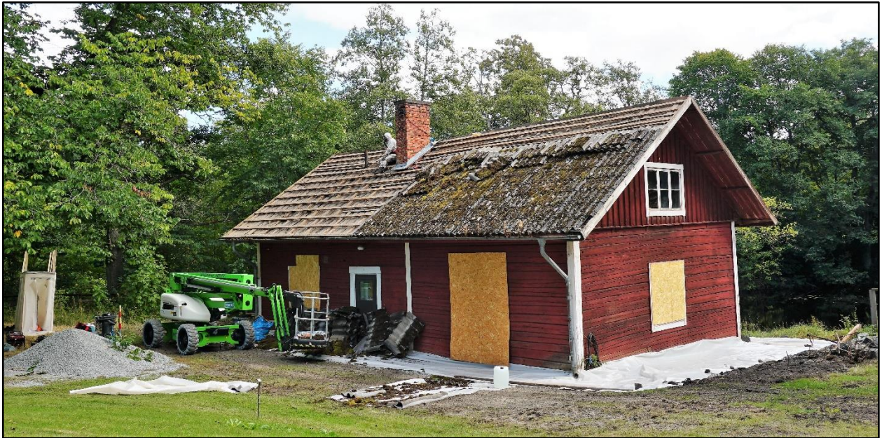
Sanering av eternittak, september 2020