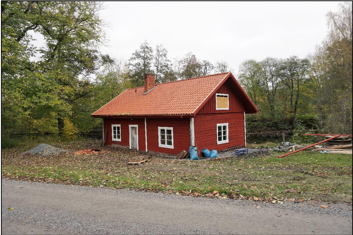
Nya teglet på plats och byggnadsställningarna nedtagna, 16 oktober 2020