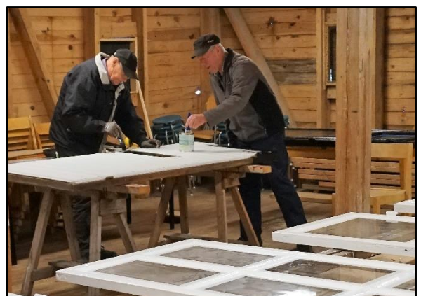
Brygghusets dörrar målas svarta, oktober 2020