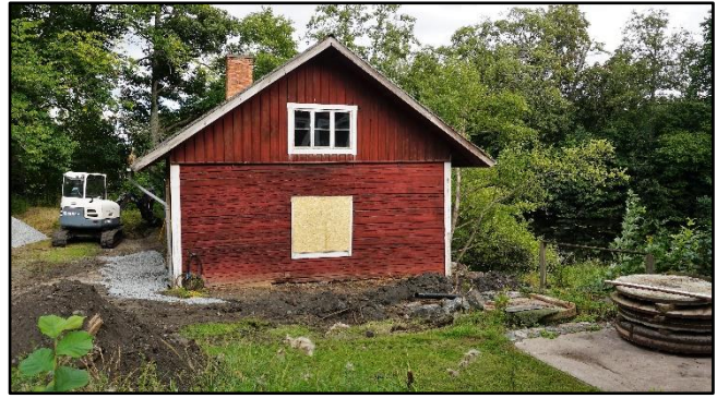
Schaktning och dränering vid brygghuset, augusti 2020