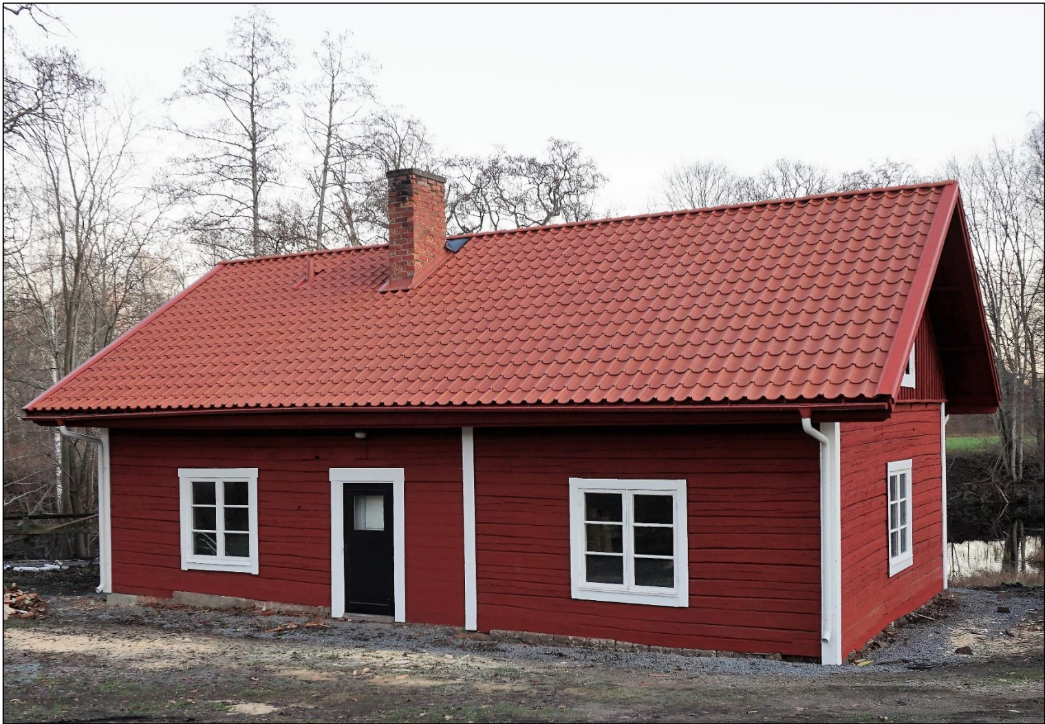
Brygghuset, västra långsidan, 23 november 2020