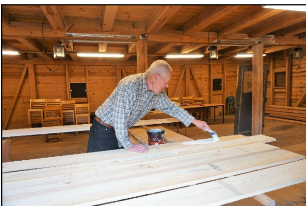
Knutbrädor vitmålas, september 2020