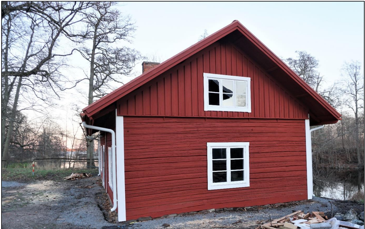
Södra gaveln, 23 november 2020