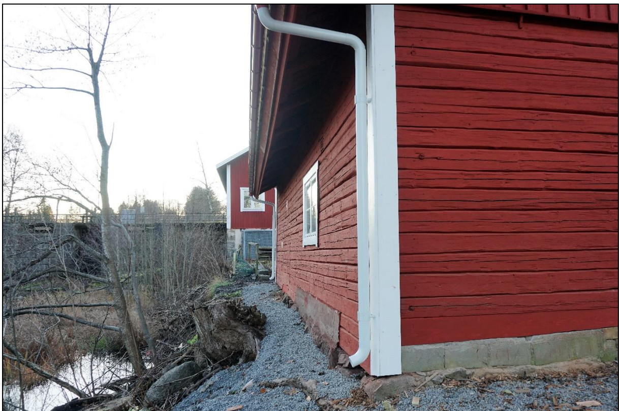
Östra långsidan, 23 november 2020