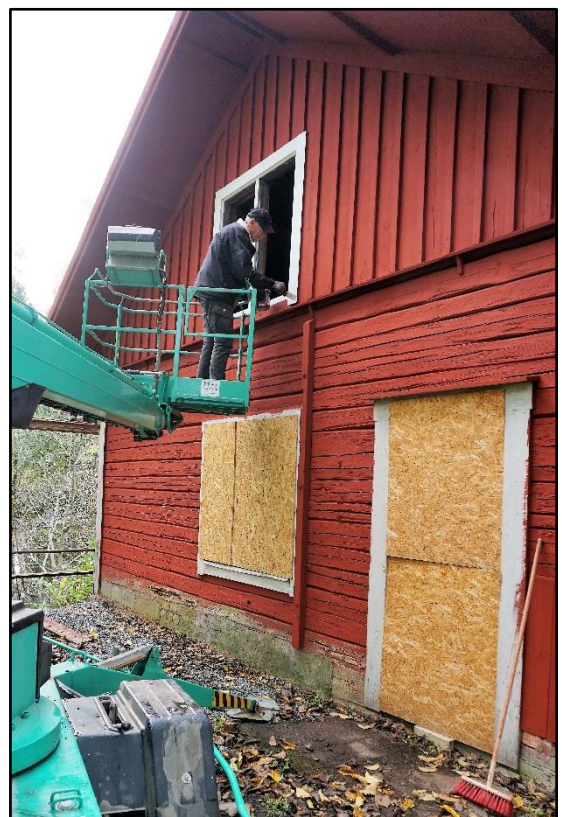
Vitmålning runt fönster och dörrar, oktober 2020