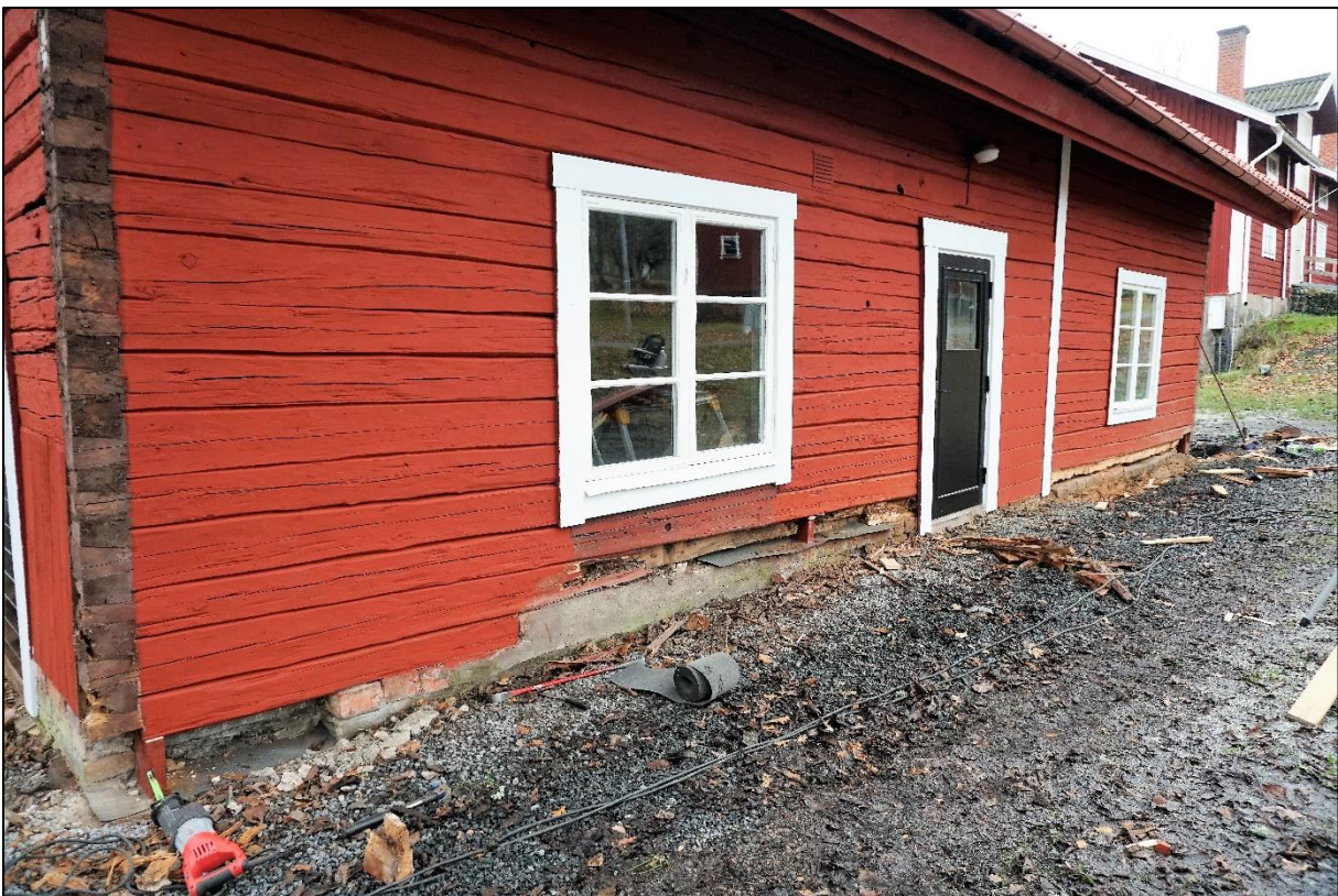
Murkna stockar tas bort, västra långsidan, 18 november 2020.