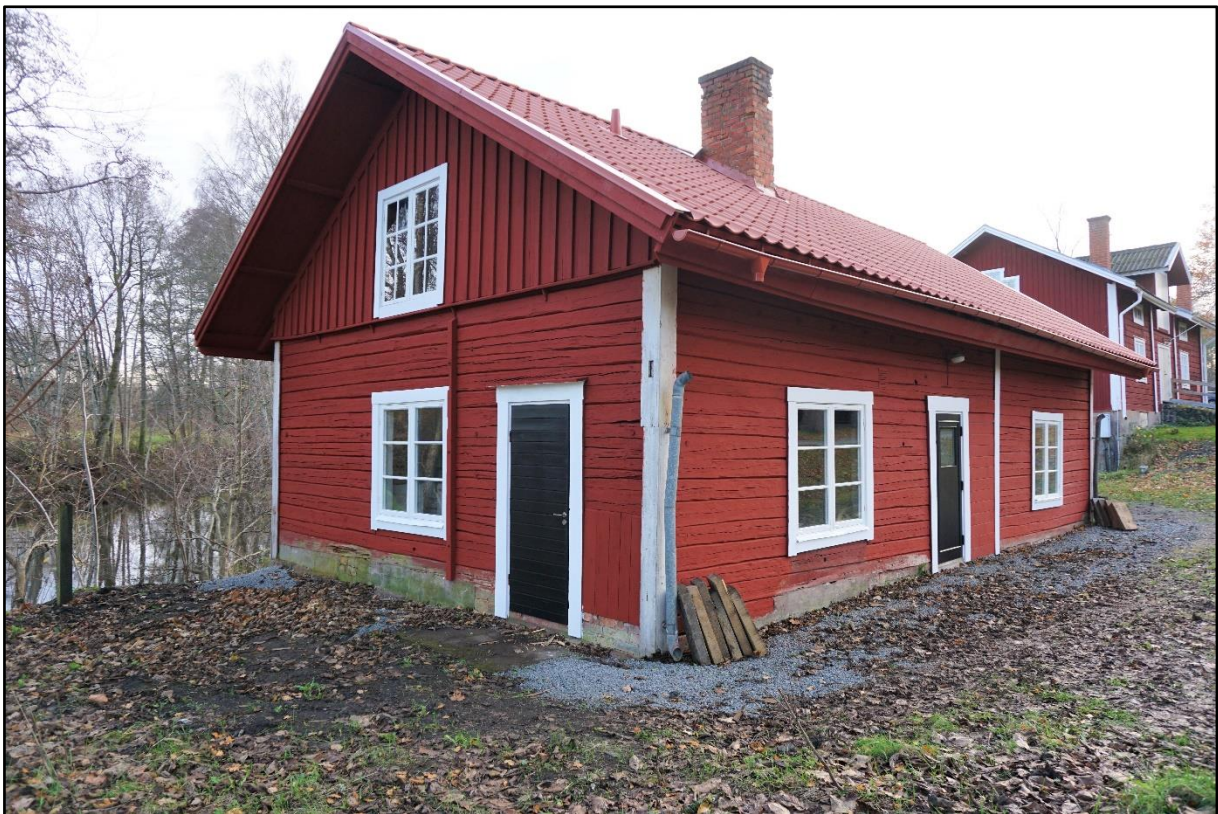
Dörrarna på plats, renoverade och nymålade, 4 november 2020