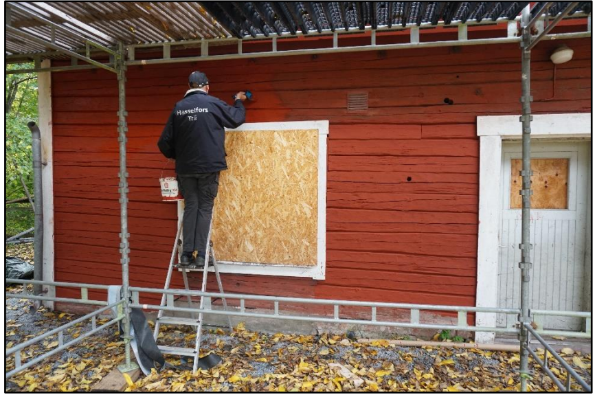
Rödfärgning av brygghuset, oktober 2020