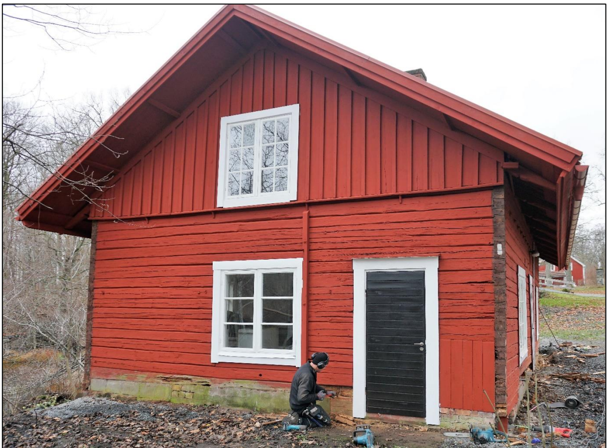
Murkna stockar tas bort, norra gaveln, 18 november 2020.