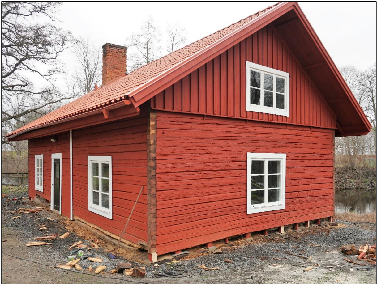
Murkna stockar tas bort, västra långsidan och södra gaveln, 18 november 2020.